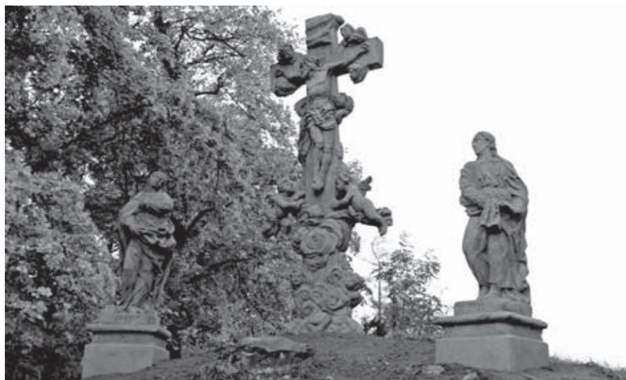
SOUSOŠÍ KALVÁRIE V AREÁLU ZÁMKU V LIBLÍNĚ