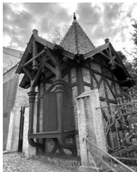
ZLATÉ CIMBUŘÍ 2023 - KIOSEK – PRODEJNÍ STÁNEK NA NÁDRAŽNÍCH SCHODECH V ŽATCI