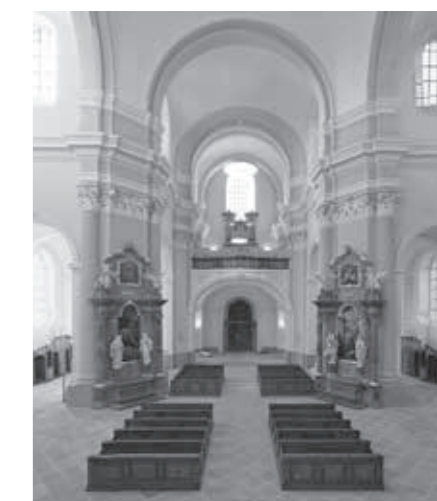
INTERIÉR KOSTELA NANEBEVZETÍ PANNY MARIE V PŘEŠTICÍCH

památek v dotačním programu Zachování a obnova kulturních památek Plzeňského kraje, tak majitelé staveb s jinou formou památkové ochrany nebo drobných kulturně významných objektů v rámci programu Obnova historického stavebního fondu v památkových rezervacích a zónách a staveb drobné architektury; kopie sochařských děl v exteriéru; podpora tvorby plánů ochrany na území Plzeňského kraje. Opomenuty nejsou ani pomníky, jejichž obnova může být podpořena z programu Podpora péče o pomníky, válečné hroby a pietní místa na území Plzeňského kraje nebo další významné a historicky cenné stavby v obcích a městech, které jsou zatím bez památkové ochrany – pro ty je určen dotační program Podpora revitalizace objektů kulturního dědictví v obcích Plzeňského kraje. ■