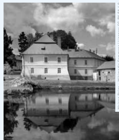
Maison Baugé