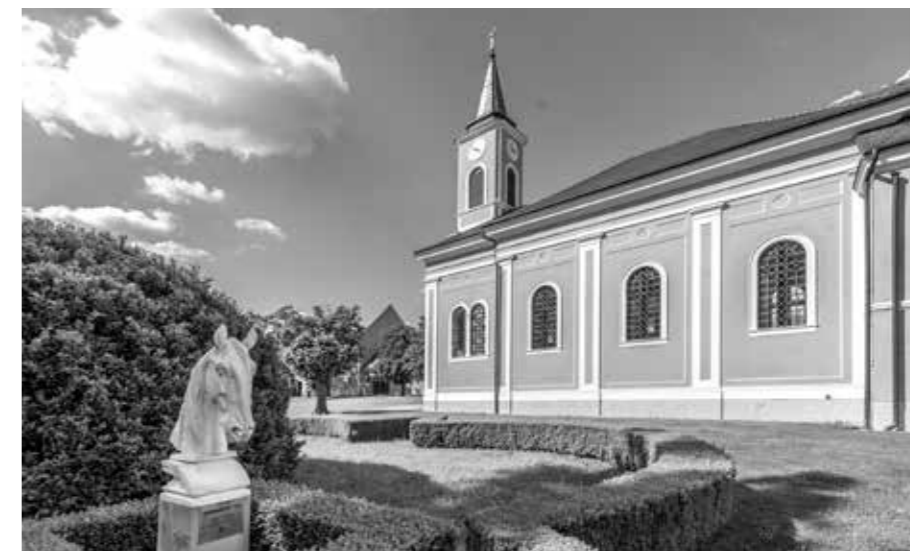
KOSTEL SV. VÁCLAVA A LEOPOLDA V AREÁLU PAMÁTKY UNESCO

Hřebčín ovšem nežije pouze minulostí, ale neustále se usilovně pracuje na tom, aby zůstal zachován v původním historickém stavu. V letech 2014–2015 byla realizována jeho rozsáhlá rekonstrukce kofinancovaná z dotace Evropské unie. Díky této obnově byla navracena původní krása 17 historickým objektům, což průběžně dozo-