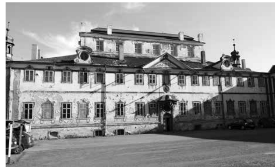
ZÁMEK KÁCOV – PŮVODNÍ STAV