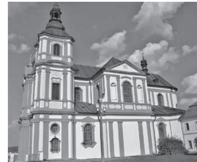
KOSTEL NANEBEVZETÍ PANNY MARIE V PŘEŠTICÍCH