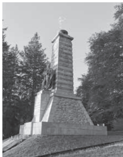
POMNÍK JINDŘICHA ŠIMONA BAARA NA VÝHLEDECH U KLENČÍ POD ČERCHOVEM