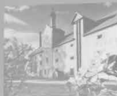
Pivovár v Lobčích