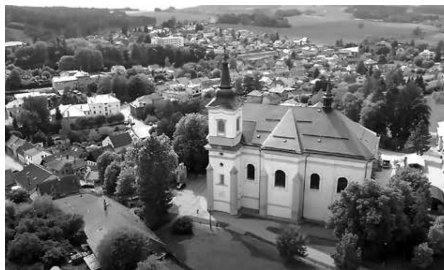
KOSTEL NANEBEVZETÍ PANNY MARIE S JIŽ OPRAVENOU STŘECHOU – POHLED OD VÝCHODU