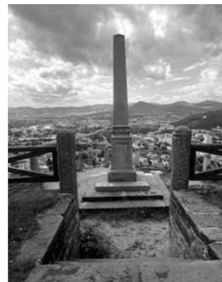
CÍSAŘSKÁ VYHLÍDKA NA KVÁDRBERKU V DĚČÍNĚ – OBNOVA PAMÁTKY Z DOTACE ÚSTECKÉHO KRAJE

Finanční prostředky z druhého programu jsou určeny na podporu stavebních a uměleckořemeslných prací souvisejících přímo se záchranou a obnovou bezprostředně ohrožených drobných památek a architektury dotvářející kulturní krajinu Ústeckého kraje, tj. hmotného kulturního dědictví, které není prohlášeno za kulturní památku ve smyslu zákona č. 20/1987 Sb., o státní památkové péči. Za drobné památky a architekturu se v tomto programu považuje drobná sakrální architektura, kterou tvoří například křížky, boží muka, kapličky, zastave-