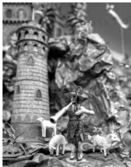
PASTÝŘ S OVEČKAMI V KRÝZOVĚ BETLÉMU