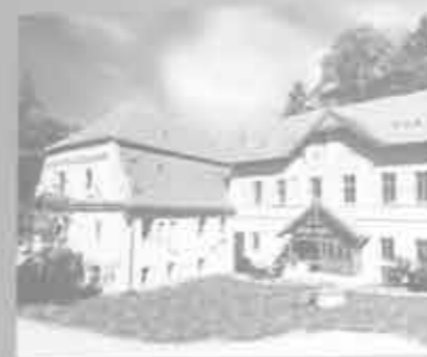
Vodní mlýn v Nové Vsi - Vepřku