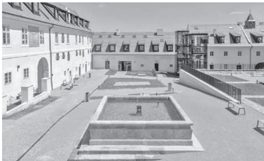
JINONICKÝ DVŮR, PRAHA