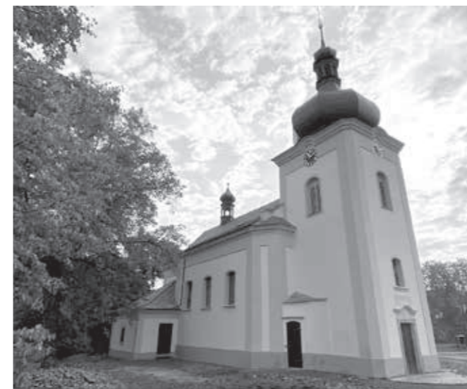
KOSTEL NANEBEVZETÍ PANNY MARIE VE ZVÍKOVCI