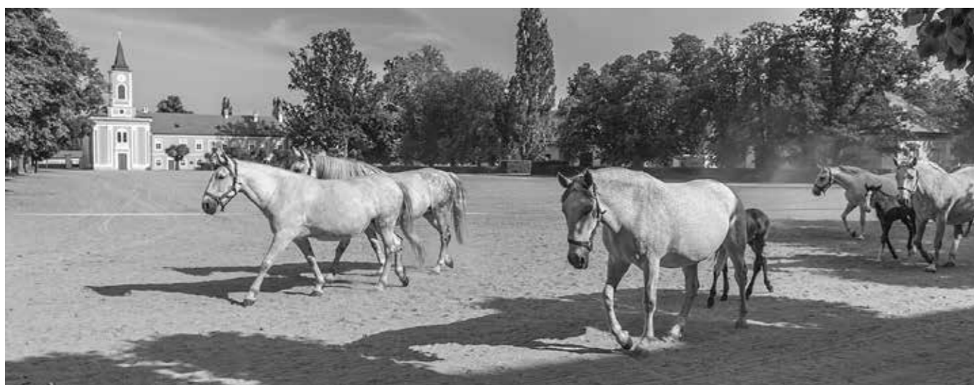
VELKÉ NÁDVOŘÍ HŘEBČINA SE STÁDEM STAROKLADRUBSKÝCH KONÍ