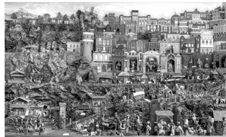
BOHATÁ ARCHITEKTURA SE SV. RODINOU V BETLÉMU EMANUELA STEINOCHERA