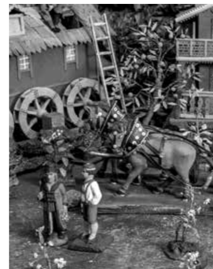
SEDLÁCI V BLATSKÝCH KROJÍCH S KOŇSKÝM POVOZEM V KRÝZOVĚ BETLÉMU