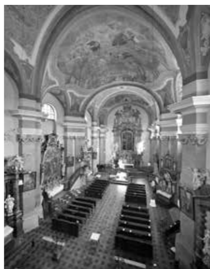
BOHATĚ ZDOBENÝ INTERIÉR KOSTELA PO DOKONČENÉ OBNOVĚ