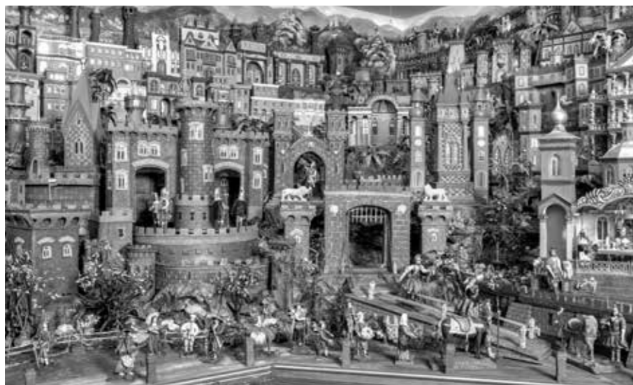
MĚSTSKÁ ČÁST KRÝZOVÝCH JESLÍ S PADACÍM MOSTEM, STRÁŽEMI A DAROVNÍKY