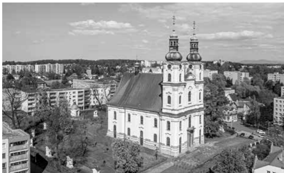
CELKOVÝ POHLED NA BAZILIKU NAVŠTÍVENÍ PANNY MARIE