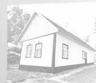
Janůšova chalupa v Žitkově