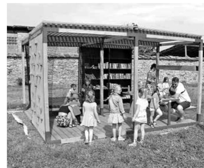
NOVÝ MOBILIÁŘ KLÁŠTERNÍ ZAHRADY