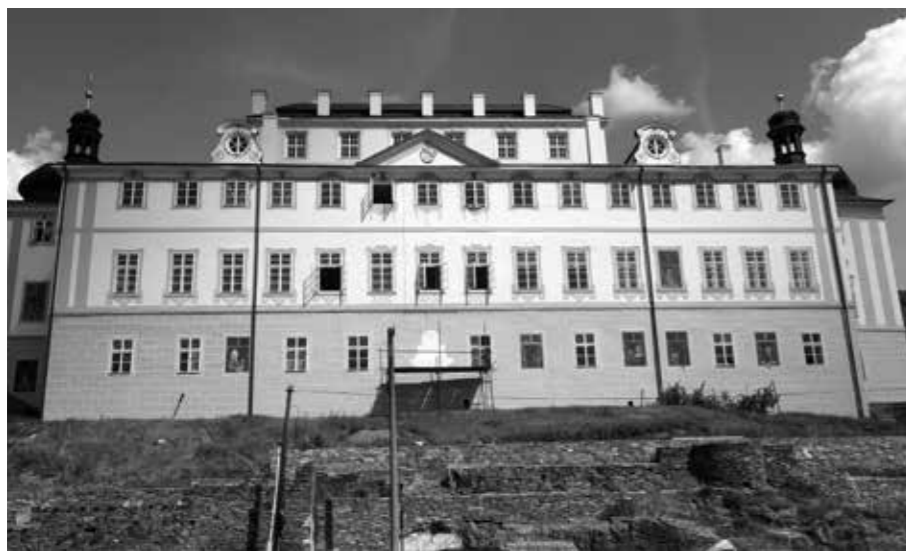
ZÁMEK KÁCOV – SOUČASNÝ STAV