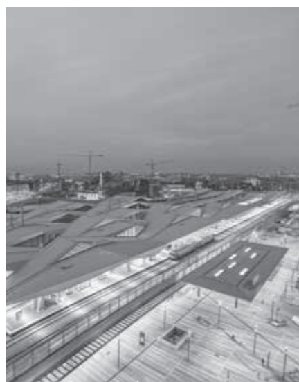
HLAVNÍ NÁDRAŽÍ, VÍDEŇ