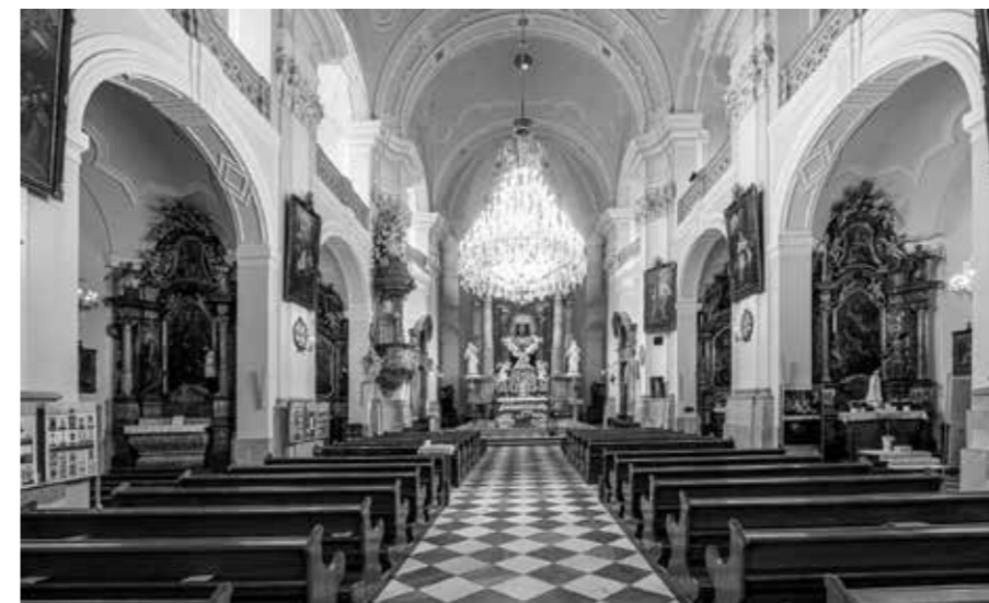
HLAVNÍ LOŽ S OLTÁŘEM