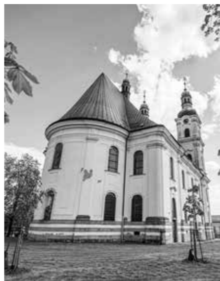
SEVEROZÁPADNÍ POHLED NA PRESBYTÁŘ BAZILIKY