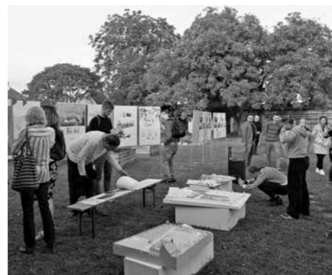
ARCHITEKTI ATELIÉRU CITY UPGRADE A STUDENTI ARCHITEKTURY Z PRAŽSKÉ A BRNĚNSKÉ VYSOKÉ ŠKOLY PŘEDSTAVILI NOVOU KONCEPCI VYUŽITÍ AREALU

Originální stavba prošla náročnou obnovou započatou v roce 2002. V první fázi bylo nutné sanovat základní konstrukce, opravovala se střecha včetně krovu a následovala obnova fasády. V roce 2014 se přistoupilo k obnově interiéru. Práce zahrnovaly především restaurování freskové výmalby, která byla zvláště ve spodní části poškozena vlhkostí. Obnova byla realizována za finanční podpory Ministerstva kultury, Královéhradeckého kraje a města Nová Paka. Římskokatolická farnost Nová Paka, vlastník kostela, po zásluze získala za dokončené restaurování interiérové freskové výzdoby kostela cenu Rady Královéhradeckého kraje Hereditas obilgat za rok 2022 v kategorii Restaurování prohlášené památky. Ve svém úsilí ale vlastník této vzácné památky nepolevuje, v loňském roce práce pokračovaly obnovou pískovcové dlažby kostela a bylo započato s obnovou mobiliáře. ■