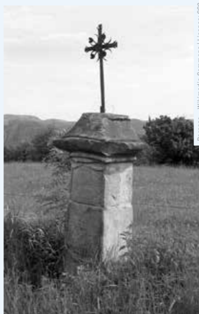
Barocco - Wikimedia Commons | Licence: CC0