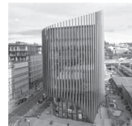
MASARYKOVO NÁDRAŽÍ, PRAHA

Odbor památkové péče Magistrátu hl. m. Prahy pokračuje chystanou konferencí v tradici, kterou započal již v roce 2016 setkáním s názvem Veřejný prostor v památkově chráněných územích. O rok později uspořádal k 25. výročí zápisu Historického centra Prahy na Seznam světového dědictví