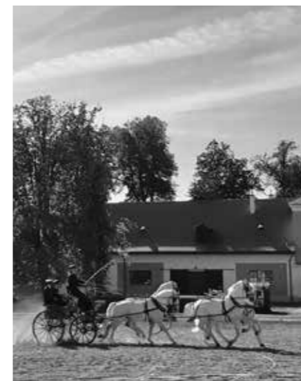
ČTYŘSPŘEŽÍ STAROKLADRUBSKÝCH BĚLOUŠŮ

Následně začaly práce na přípravě odborných materiálů a nominační do-