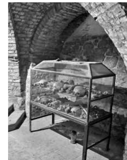
KRYPTA S OSTATKY POUTNÍKŮ