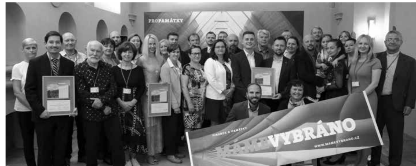
FINALISTÉ. SLAVNOSTNÍ VYHLÁŠENÍ NA PŮDĚ MINISTERSTVA KULTURY